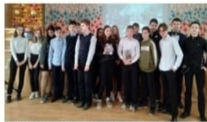
Медиапредставитель с использованием видеореформатов из документального фильма «Шаг в бессмертие»

17 марта сотрудники отдела обслуживания Центральной районной библиотеки им. 1 Мая провели в школе №77 вечер памяти под названием «Шаг в бессмертие», посвящённый русским десантникам, которые с честью выполнили свой воинский долг и ценой собственных жизней оставили противника. Ведущая рассказала своим рассказом о причинах военного конфликта – Втора Чеченского войны, во время которой произошло это героическое сражение бойцов шестой роты с боевиками – бой на высоте 776. Они выполнили поставленную им боевую задачу, сорвали планы террористов и защитили честь и достоинство ВДВ России, дивизия которой – «Яблоко России».