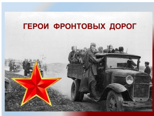
Фото ( представлены отдельные кадры презентации ), полностью презентация представлена в папке «фото»: