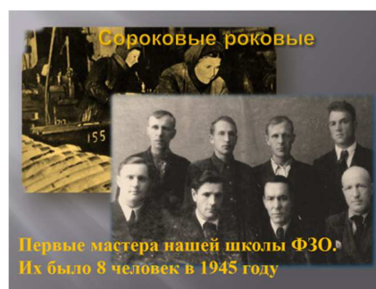
Рис.6-9. Фрагменты виртуальной экспозиции о педагогах нашего учреждения - участниках Великой Отечественной войны 1941-1945гг.

4. Продолжалась систематизация и изучение материалов о наших землячках - участницах Великой Отечественной войны. Продолжалось копирование и сканирование имеющихся материалов. Это позволило использовать их для создания передвижной выставки «Светлокосый солдат» и для создания виртуальной экспозиции под тем же названием.