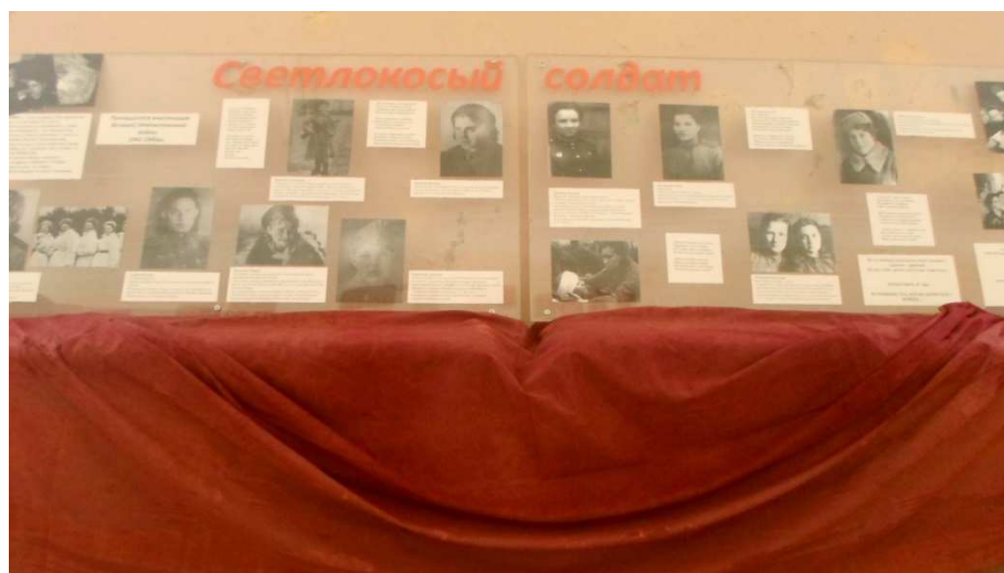
Рисунок 10. Передвижная выставка «Светлоко́сый солдат»