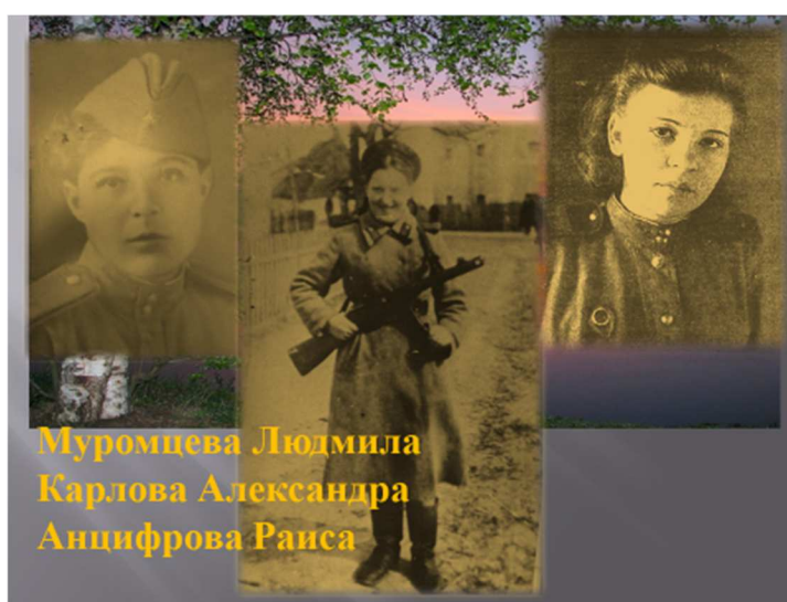
Рисунок 11,12,13,14. Фрагменты виртуальной экспозиции «Светлокосый солдат»