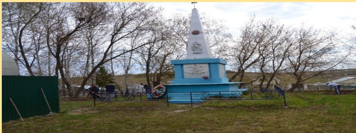
Общий вид памятного мемориала села.

Уже третий год они собирают материалы об ушедших на фронт из этого села и не вернувшихся с фронта. Им довелось побеседовать со старожилами этого села. Они рассказали как началась война и как всем селом провожали добровольцев на фронт. Затем отправились к мемориалу и с чувством большой ответственности и долга поработали на совесть.